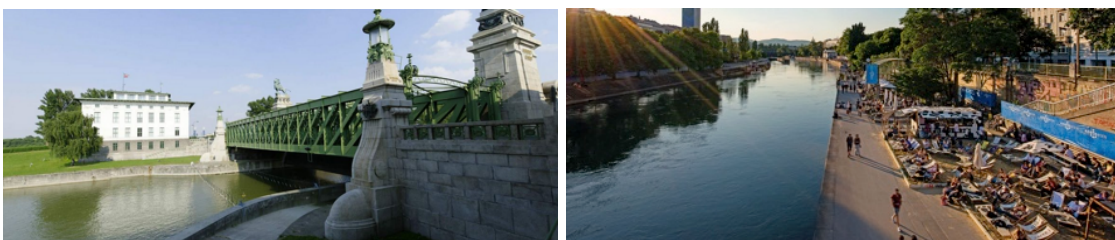
Wien-Nußdorf/Brigittenauer Sporn – Central Garden/Donaukanal.

Am Freitag, 6. Mai 2022, 17.30 Uhr startet auf dem Donaukanal in Wien die 1. CleanDanube_Compensation . Kanut:innen und SU-Paddler:innen verfolgen den „schwimmenden Professor“ Andreas Fath* . Sieger:in ist, wer ihn als Erste:r (der Kategorie) eingeholt hat.